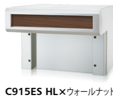
C915ES HL×ウォールナット (ダイノック™ FW-332)