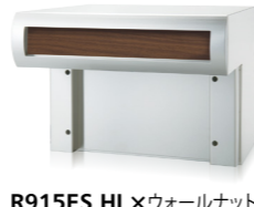
R915ES HL×ウォールナット (ダイノック™ FW-332)