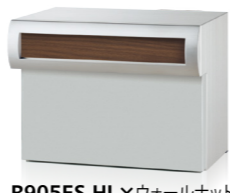
R905ES HL×ウォールナット (ダイノック™ FW-332)