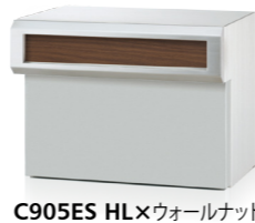
C905ES HL×ウォールナット (ダイノック™ FW-332)